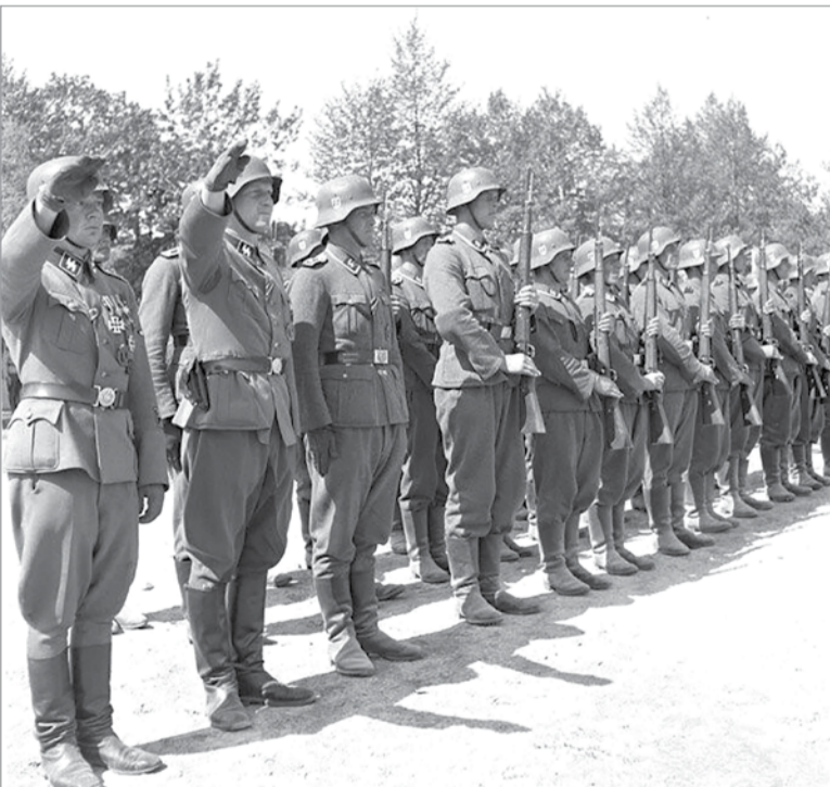
Финские легионеры из состава элитной дивизии СС «Викинг»