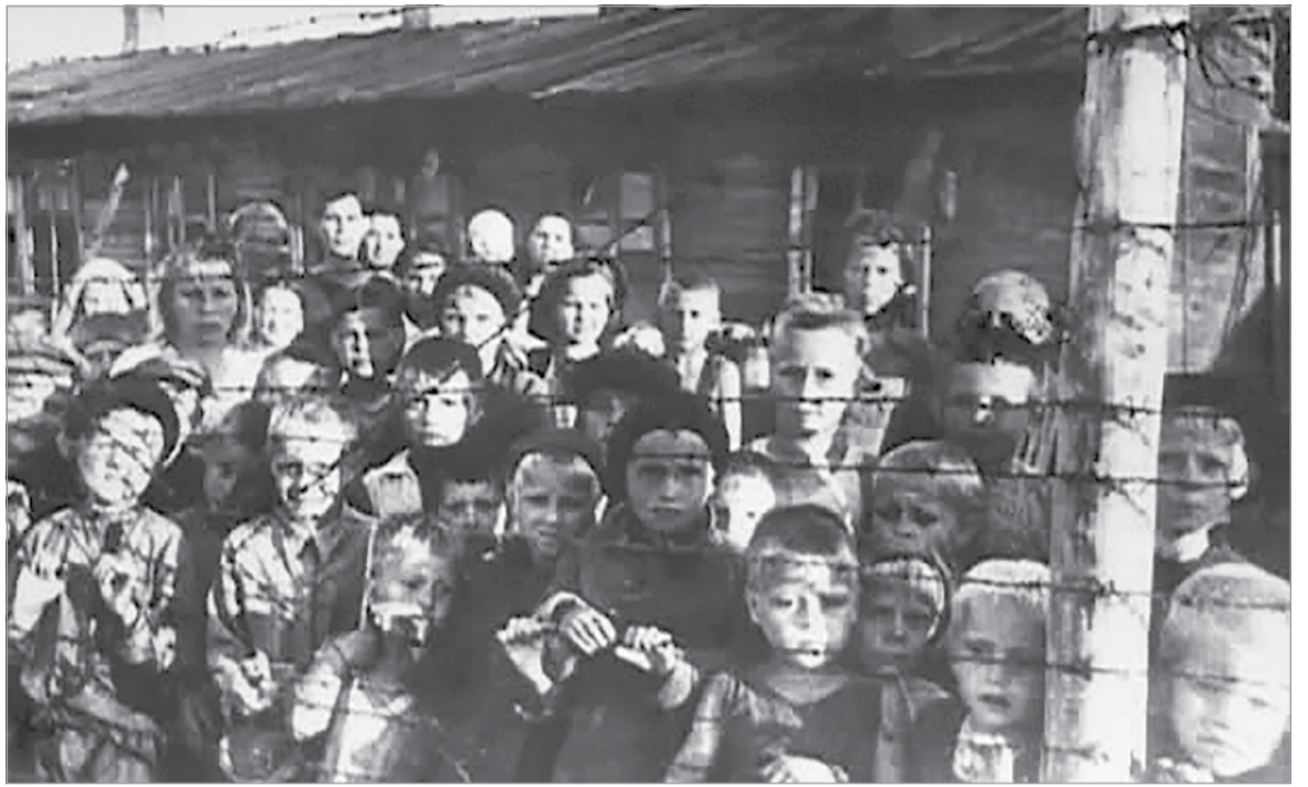
Дети в финском концентрационном (переселенческом) лагере. 1944 г.

Далеко не все современные жители осведомлены о том, что наряду с Лодейнопольским и Подпорожским районами